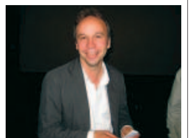
L'année démarre bien!