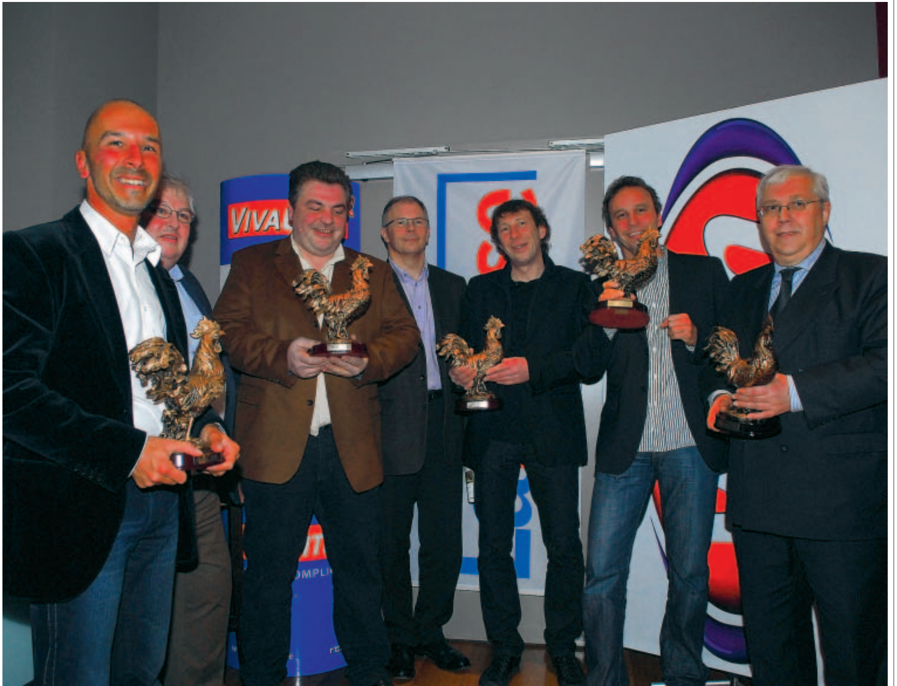
L'asbl Non à Mâle Plume, extraordinaire prototype de mobilisation citoyenne, a reçu le plus de votes de nos lecteurs: une belle reconnaissance!